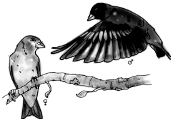
Cardenalito de Venezuela ( Sporagra cucullata )

Con la finalidad de difundir una campaña informativa de concienciación hacia la protección y conservación del Cardenalito de Venezuela y demás especies amenazadas, se han planificado una serie de actividades con la participación de docentes y estudiantes de todos los subsistemas educativos, comunidades organizadas, organizaciones gubernamentales, ONG y todas aquellas personas que se sientan sensibilizados ante esta problemática.