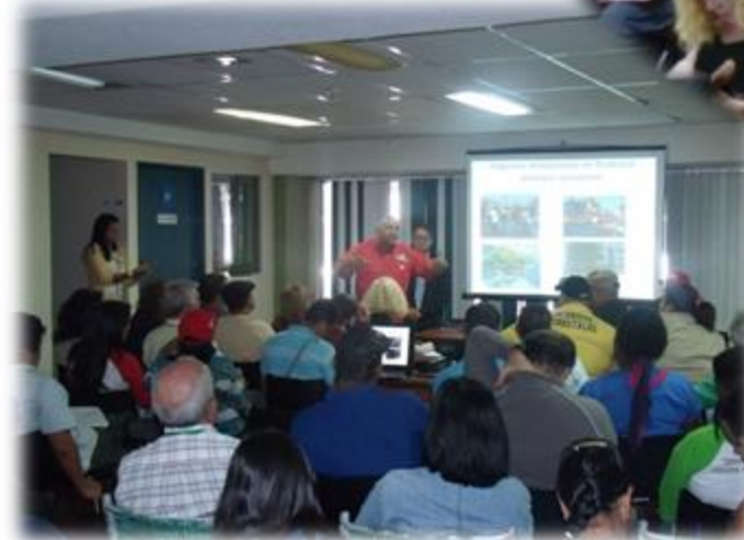
funcionarios del Minamb